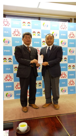
伊奈町社会福祉協議会