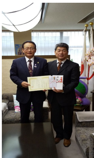
上尾市社会福祉協議会